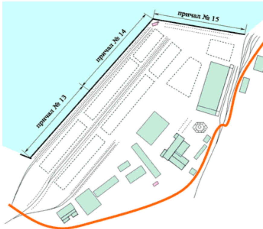
Рис. 4-3. Схема 2-го грузового района

Причал 15 оборудован порталными кранами типа «Кондор» (3 ед.), грузоподъемность которых в грейферном режиме составляет 16 т.