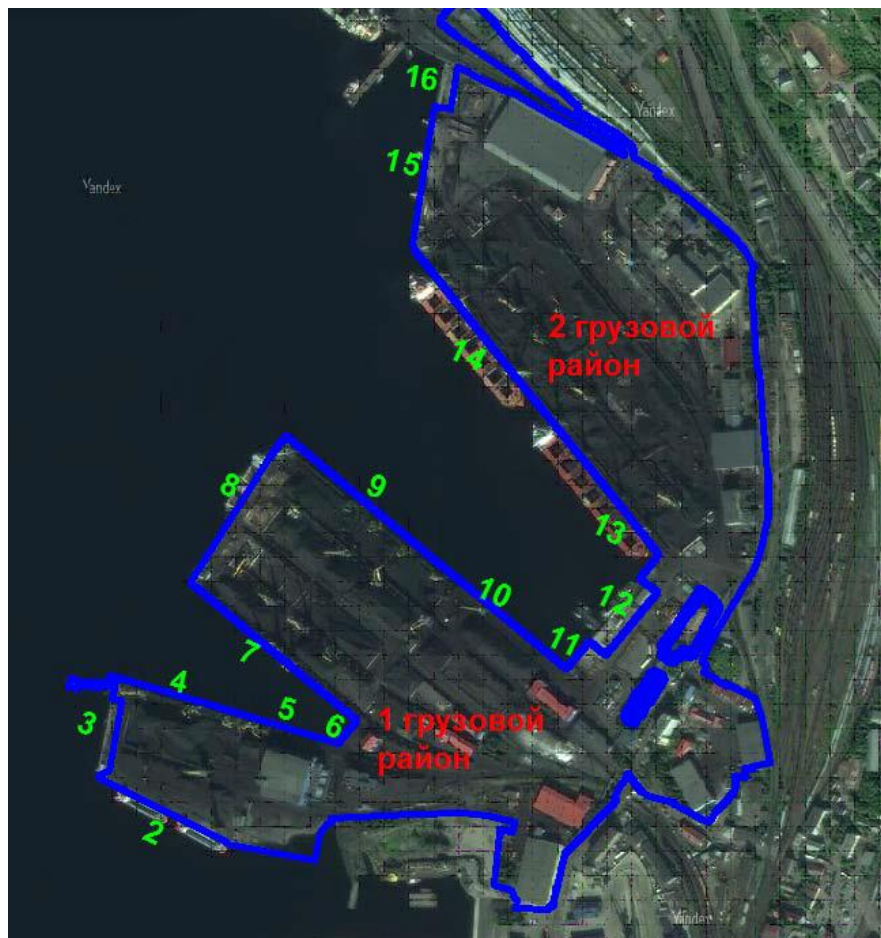
Рис. 4-1. Карта-схема промышленной площадки АО «ММТП»

Общая длина причалов составляет 3278,2 м.